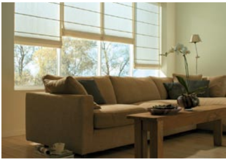
Alla rum får sin unika prägel förstärkt av ett elegant solskydd.